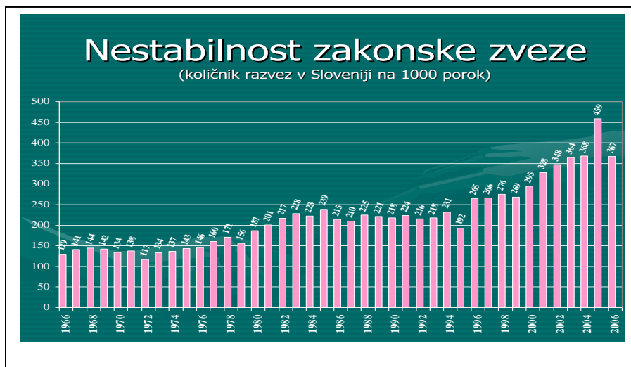
Tabela 22: Število razvez na 1000 sklenjenih zakonskih zvez v Sloveniji

5. Poznejše razveze: V zvezi z razvezami lahko govorimo tudi o pojavu poznejših razvez. Ne samo sklepanje zakonskih zvez, tudi razveze se pomikajo v poznejša leta. V letu 2005 so zakonske zveze trajale pred razvezo povprečno 16 let. Pred tremi desetletji je bila več kot tretjina takih, ki so bile razvezane v prvih štirih letih zakona , in samo 12 % je bilo takih, ki so bile razvezane po več kot 20 letih zakona.